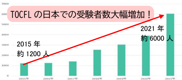
台湾華語能力試験 TOCFL レベル対応